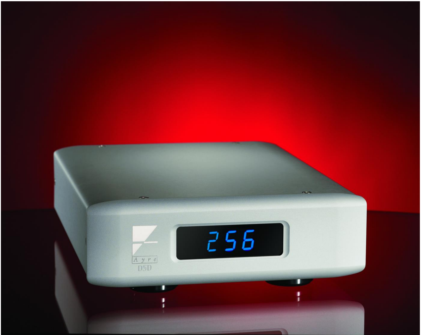
QB-9 Twenty DSD256(4x) / PCM384 USB DAC